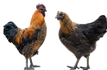
云乌1号配套系 (培育中)