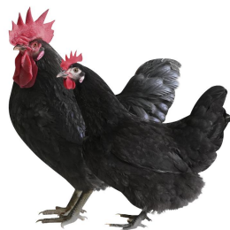
湘佳黑鸡配套系 (培育中)