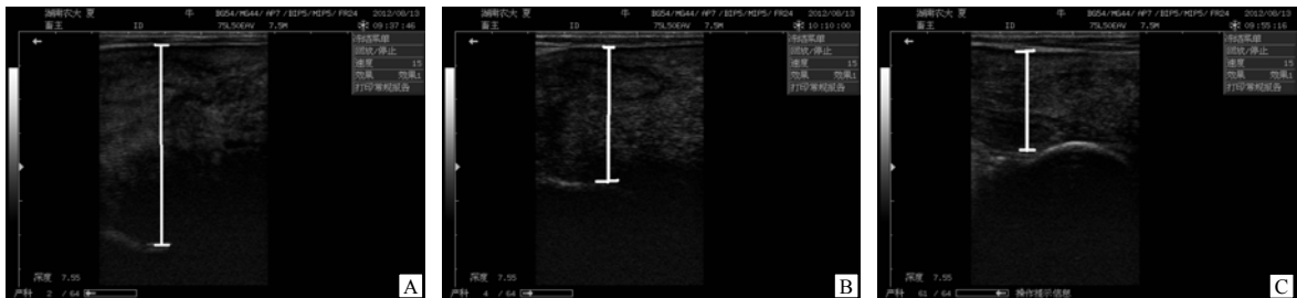
图 2 B 超显示的子宫孕角变化

阳性率为抗体阳性奶牛在各组的比率;抗体阳性奶牛指抑制素抗体 P/N 值大于 2 的产后奶牛。下同。